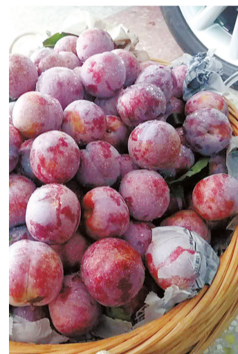
信宜钱排三华李闻名全国。