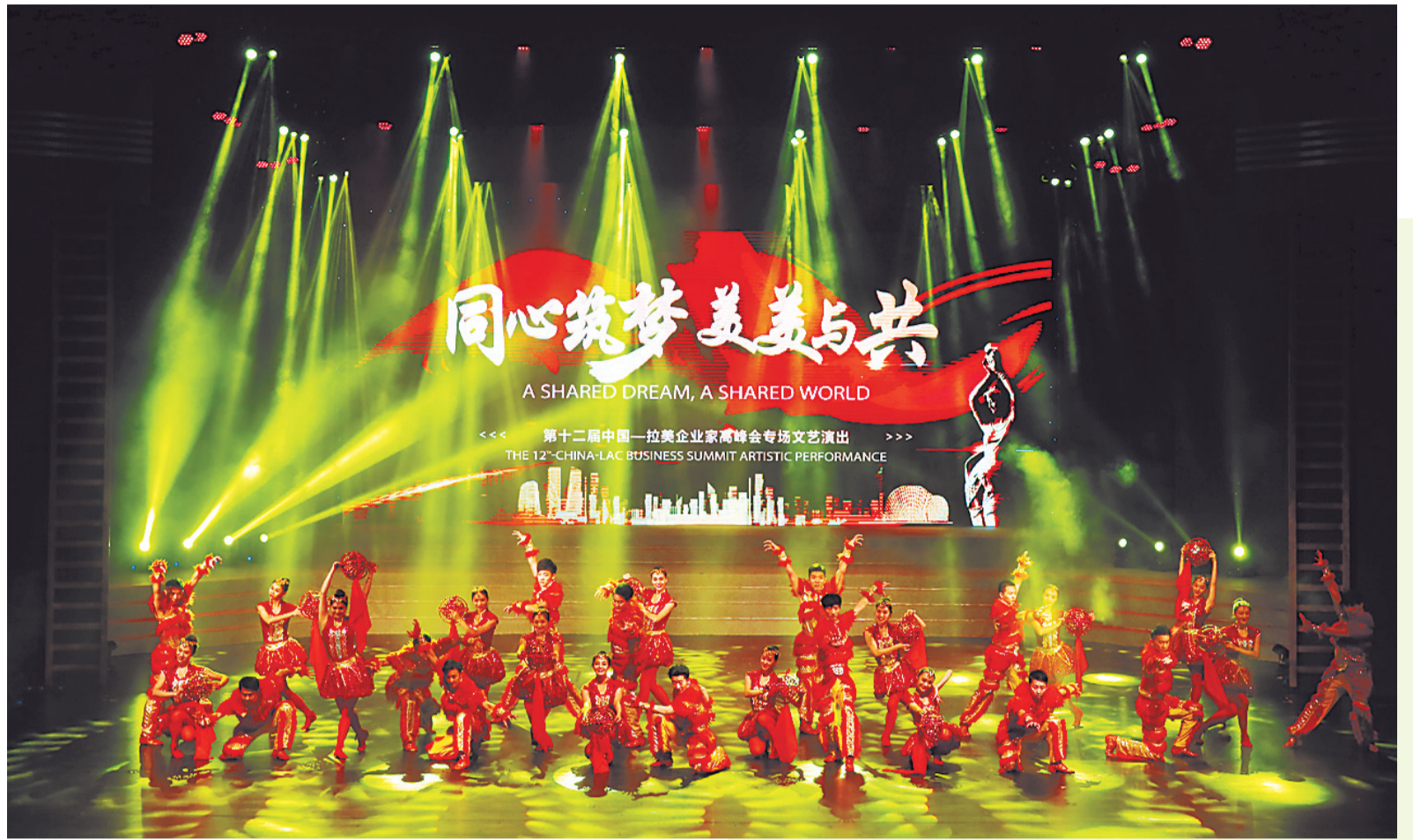
第十二届中拉企业家高峰会专场文艺演出昨晚举行。