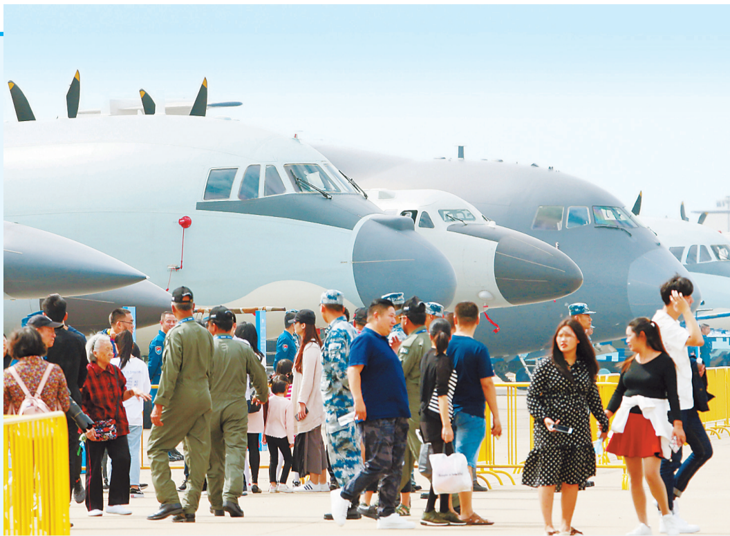
11月4日,各种参展飞机已陆续停放航展停机坪处。

面向全球扩大创新合作,持续提高对外开放水平,中国航展再度邀约世界,相聚珠海。扬帆起航的粤港澳大湾区魅力之城,一场创新涌动、活力迸发的蓝天盛会即将开启。