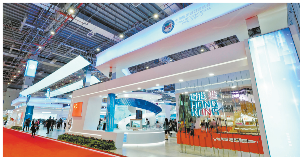
11月5日拍摄的中国馆一角。

新华社上海11月6日电 作为主办方,在首届中国国际进口博览会的国家展上设立了中国馆。占地约1500平方米的中国馆,取名“共羽华平”,向世界展示着中国的新发展理念和发展成就。复兴号的“中国速度”、会动的绿水青山图、中欧班列电子沙盘、港澳台展区等,令中国馆看点十足。 商务部外贸发展事务局局长吴政平介绍,中国馆的设置以创新、协调、绿色、开放、共享的新发展理念为主线,充分结合进博会“新时代,共享未来”的主题,注重大气和开放。“整个中国馆内部没有设置一面墙,也没有打任何隔断,完全是通透的、开放的。”他说。