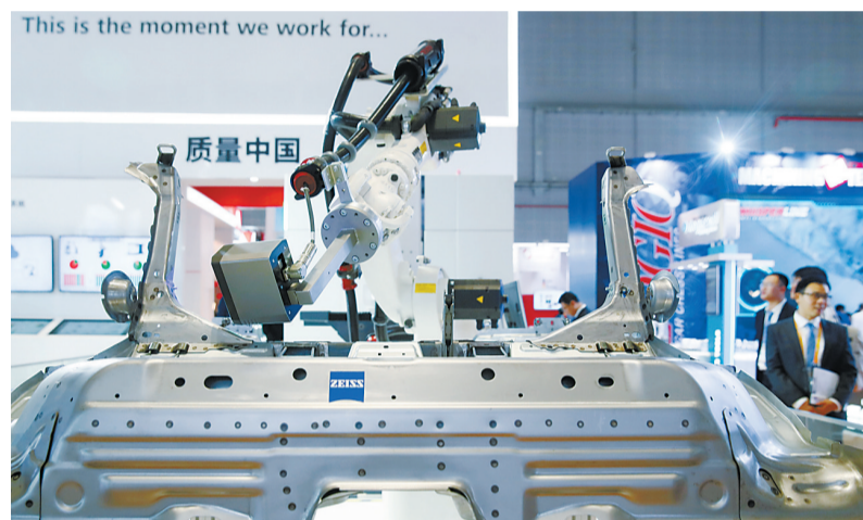
德国卡尔蔡司公司的一架精密检测机器人在展台上展出(11月6日摄)。在首届中国国际进口博览会上,各国工业和互联网巨头都带来了人工智能(AI)技术,在中国“首秀”。