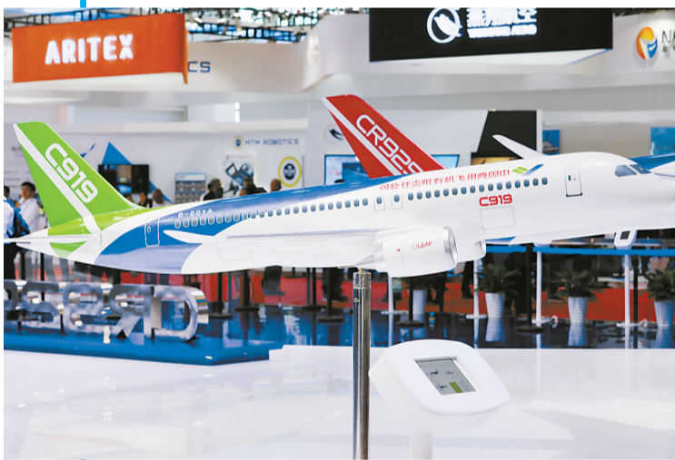
CS919飞机模型。