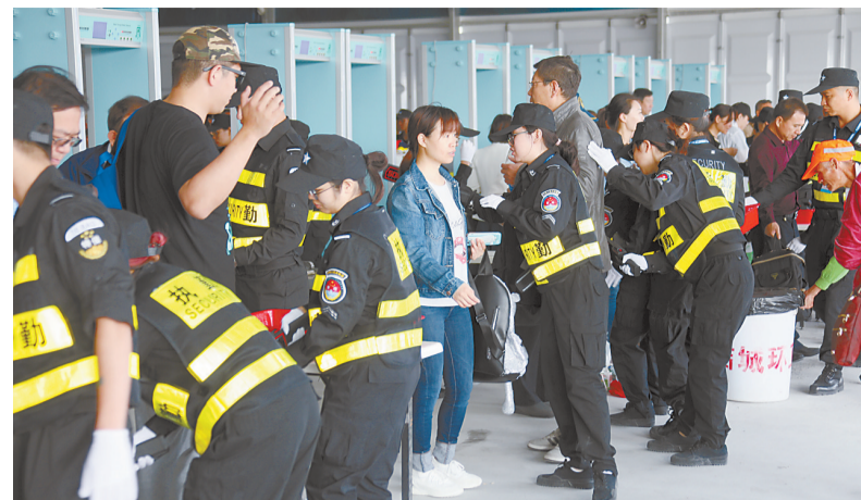
保安员细心地对每位观众进行安检。

本报讯 记者宋一诺报道:6天累计安检入场总人数超过40万人次,巡逻队员日巡超三万步……为做好本届航展安保工作,珠海保安集团共投入安保力量1.2万余人次为航展护航,同时首次投入使用“航展现场云警指挥平台”,充分利用科技优势提供优质服务保障。