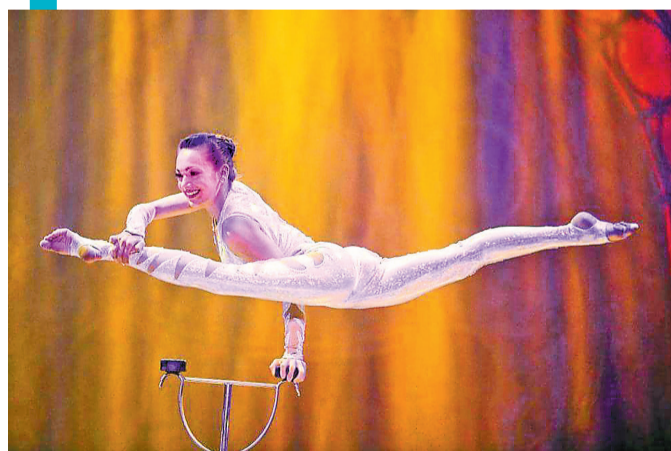
阿根廷柔术射箭表演。

队带来的《时光流转-魔幻飞球》,把蹬球这项杂技门类玩到极致。借助摩天轮表演道具,原本在地面表演的蹬球实现了立体化展示。女孩们在摩天轮道具上花式蹬球,同时借用U型道具进行相互抛接。表演还借助树干形状的弹板道具,球被依次层层弹上道具顶端的网兜内。整个表演在黑暗中采用灯光、荧光进行烘托,球影和道具线条在变换中流动,给人一种时光流转之感,美轮美奂,引人入胜。