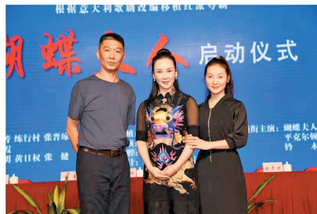
红派粤剧《蝴蝶夫人》主创在复排启动仪式上。

本报讯 记者高松 熊伟健报道:12日,由广东省艺术研究所和广州红线女艺术中心共同扶持,珠海市粤剧团监制的红派粤剧《蝴蝶夫人》复排启动仪式在广州举行,红派粤剧《蝴蝶夫人》主创悉数到场。