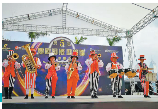
马戏节文化惠民演出走进香港。

本报讯 记者陈颖报道:13日下午,香港文化中心广场,一场露天马戏盛宴上演,中国国际马戏节文化惠民演出首次走进香港,与香港市民共同分享全球顶尖马戏节目的精彩。