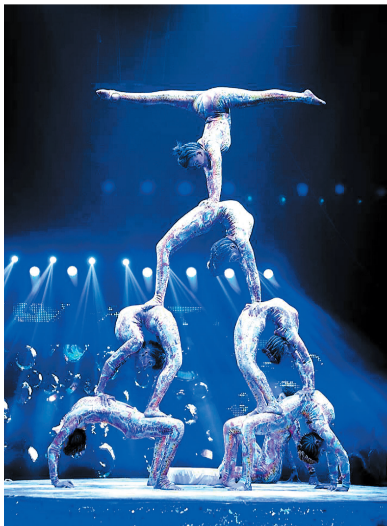
埃塞俄比亚“金钻”团队柔术表演。