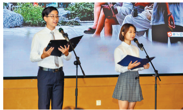
大学生选手在比赛中。

本报讯 记者高松 熊伟健报道:12日,“苏曼殊杯”珠海大学生诗歌诵读大赛暨红色经典诵读大赛在北京师范大学珠海分校举行,来自珠海各高校的300余名师生共同诵读诗歌,回顾经典,感受诗意青春。