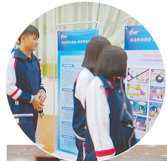
斗门区网络安全宣传进校园活动在珠海市理工职业技术学校斗门校区举行,斗门公安分局网安大队网络安全专家与150余名计算机网络安全专业师生共聚一堂,学习网络安全知识,共筑校园安全“防火墙”。

主办方还在校园内设置了网络安全知识宣传栏,并向师生发放了《中华人民共和国网络安全法读本》《网络安全防范公益漫画》《网络诈骗手法汇总》等宣传手册1000余册。