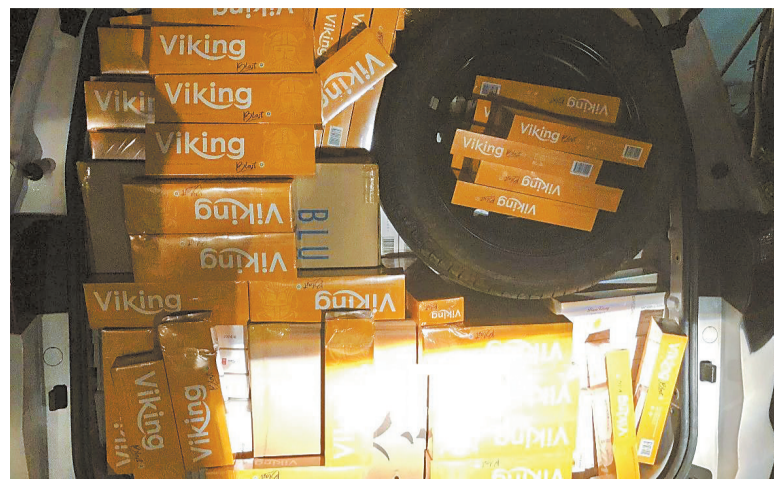
长安面包车上被遗弃的香烟价值超50万元。

最后目标车辆被追至服务区后面的停车场和篮球场之间,警方走近查看发现,这辆粤AZ826G号长安面包车车牌是伪造的,粤AZ826G号属于一辆灰色福克斯小车,司机已不见踪影。车内装有大量的“红双喜”“黄鹤楼”“VIKING”“天香”等香烟。经斗门烟草专卖局工作人员对现场进行清点,面包车内