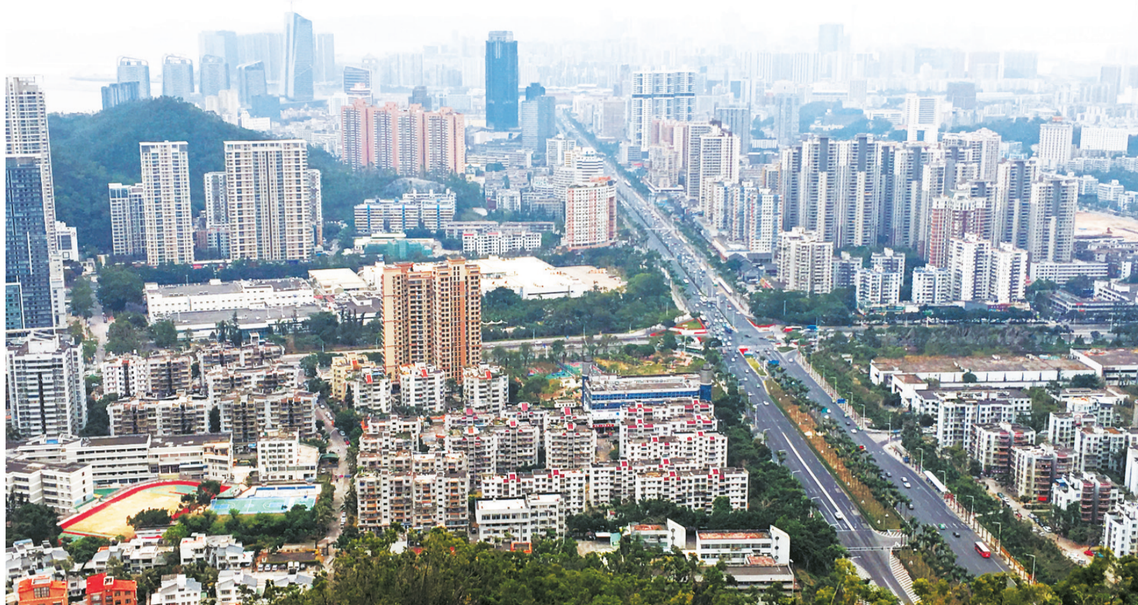
拱北城区高楼林立。