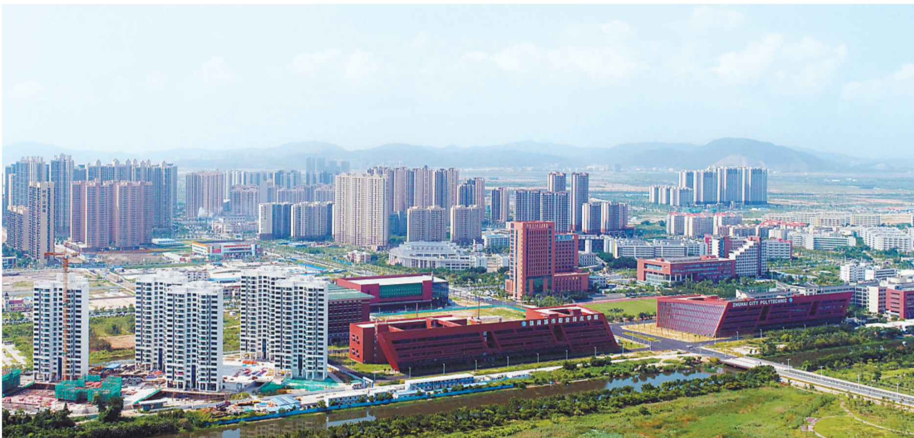
站在金湾立交往金湾方向眺望,航空新城一栋栋高楼拔地而起。