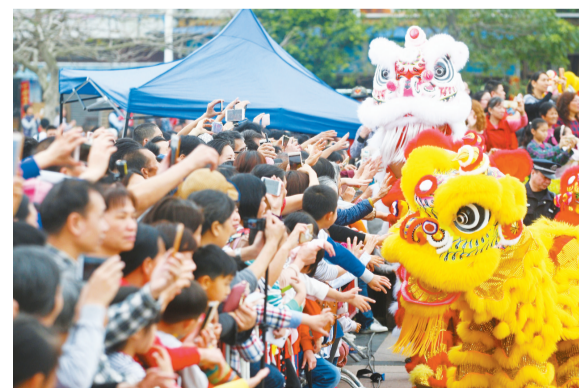
2018年斗门民间艺术大巡游吸引众多观众。