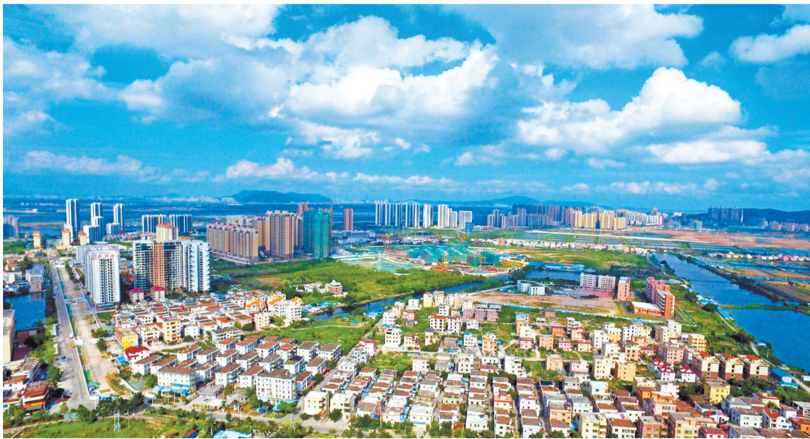
改革开放不停步,活力斗门不断提升市民获得感幸福感。