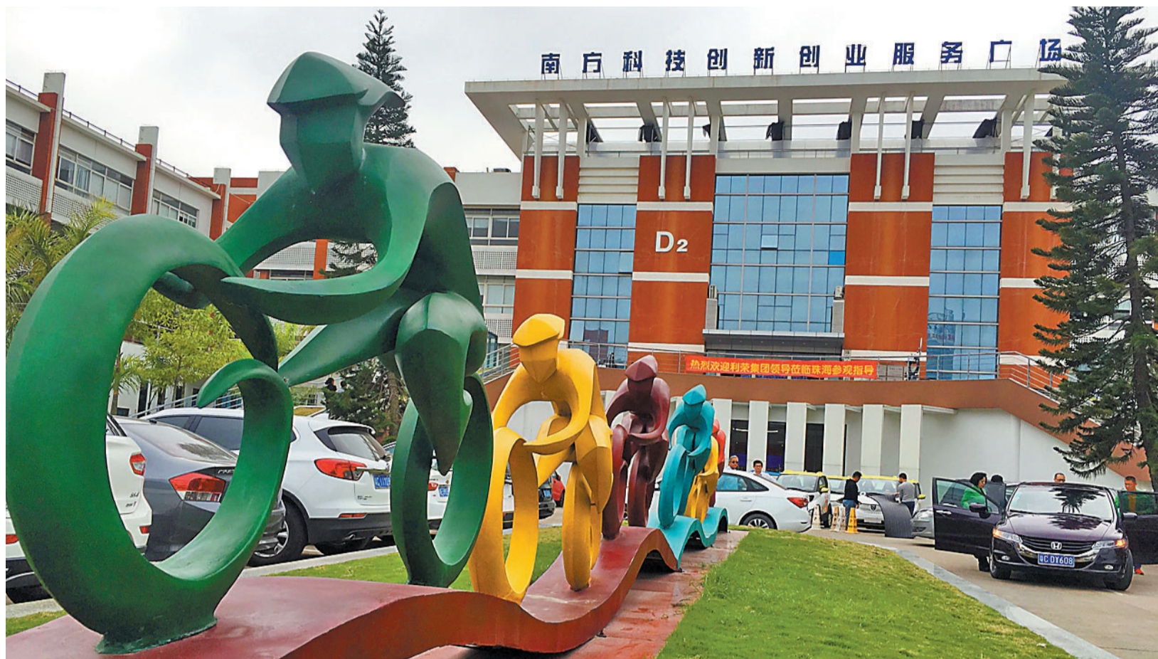
高新区南方科技创新创业服务广场。