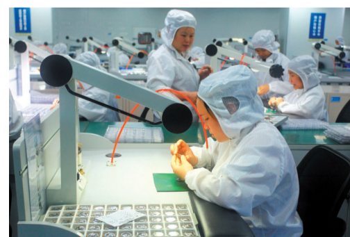
员工全身严密包裹开展生产。

“当前,高新区关键是抢抓粤港澳大湾区建设、港珠澳大桥正式通车运营等千载难逢的重大历史机遇,把发展机遇转化为发展优势,同时充分借鉴国内外先进经验,高起点高标准建设发展,后来居上,早日跻身国内一流高新区行列。”闫昊波认为,高新区将重振特区“敢闯敢拼”“杀出一条血路”的精气神,进一步激发奋进新时代、开启新征程的壮志豪情,干出无愧于新时代的新业绩,推动高新区一年一变样,三年上新台阶。