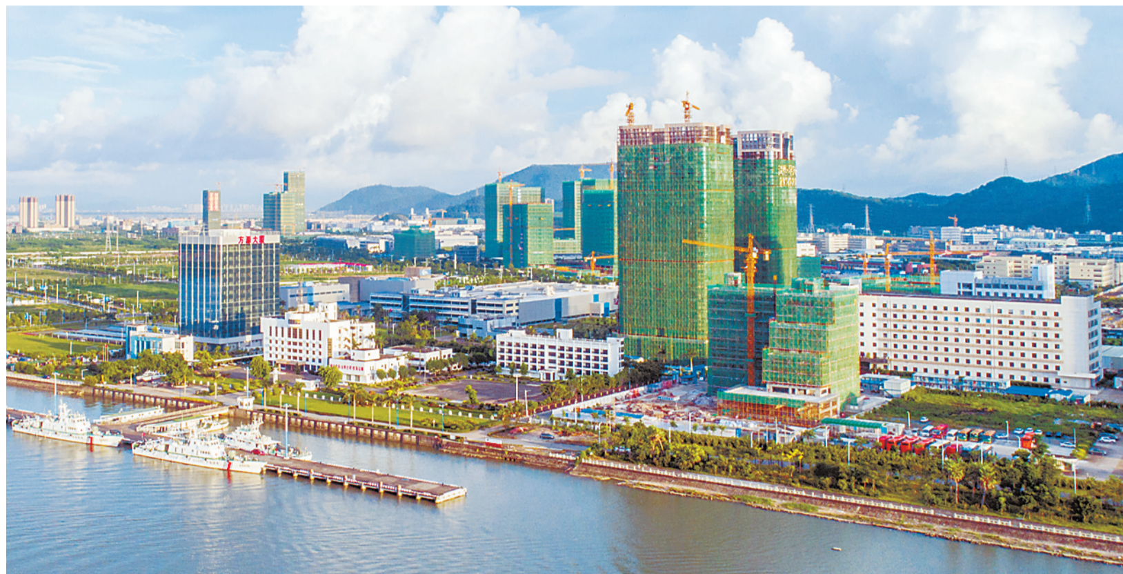
高速发展中的保税区一栋栋高楼大厦拔地而起。