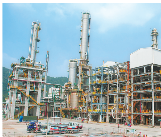
珠海BP化工有限公司。

据了解,高栏港区将通过实施创新驱动“群星工程”,切实提升企业自主创新能力及发展质量,支持企业通过技术改造实现转型升级,力争今年新增新型研发机构1家,新增创新平台5家;积极培育高新技术企业,开展高新技术企业树标提质行动,力争高新技术企业达100家;构建创新孵化育成体系,加快建设全国深海海洋工程装备产业知名品牌创建示范区、高栏2025加速器项目;加强人才工作,强化政策聚才、筑巢引才、环境留才、服务惠才,打造珠海西部创新型人才高地;推进质量强区建设,提升产品、技术、服务、工程等各方面标准;继续努力建设绿色园区,积极探索生态优先、绿色发展新路径。