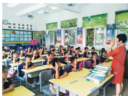
珠海教育给市民带来了实在的“民生福利”。

在强化区域统筹功能的基础上,落实学校用人自主权,进一步激发教师队伍活力,促进区域内师资优质均衡配置,大力推进教育公平,办好人民满意的教育。实行校长职级制,拓展校级领导职业发展空间,促进校长队伍专业化建设。推行中小学教师“县管校聘”管理制度改革,促进区域内师资优质均衡配置。创新和规范中小学教师编制配备,探索教师编制不足背景下有效的师资补充途径和办法。