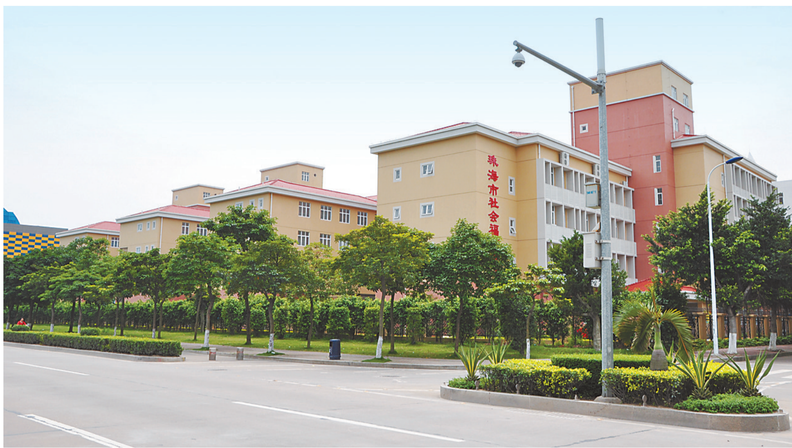
新近建设的珠海市社会福利中心投入使用。