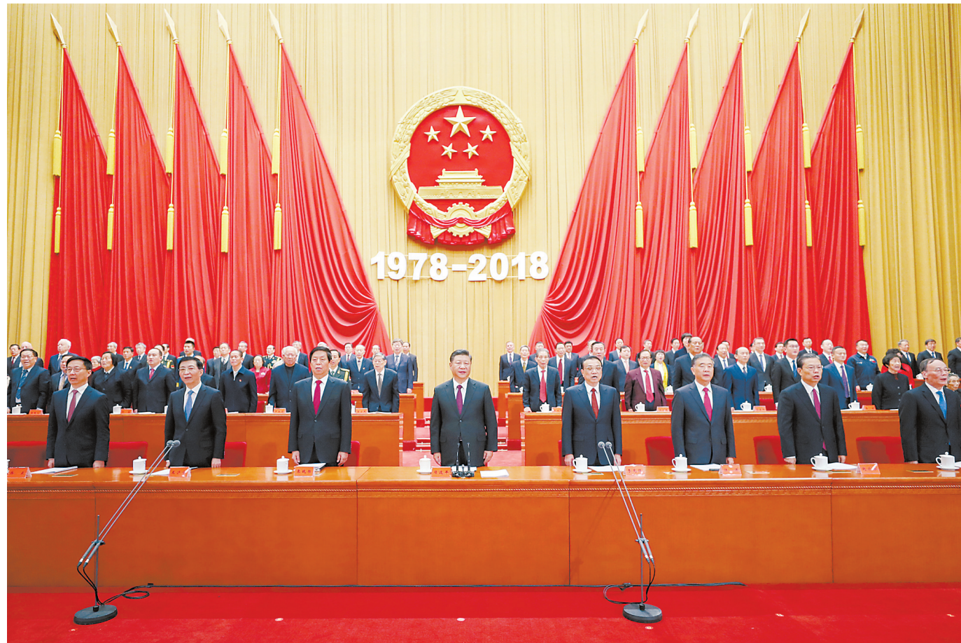
12月18日,庆祝改革开放40周年大会在北京人民大会堂隆重举行。中共中央总书记、国家主席、中央军委主席习近平在大会上发表重要讲话。新华社发