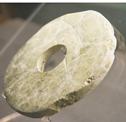
这是良渚文化遗址出土的黑陶器、玉琮、木屐、漆器、陶片和玉璧(左上起,顺时针方向)。

文化瑰宝,也是全人类共同的文化遗产。遗产地政府将严格遵守《保护世界文化和自然遗产公约》,把这一文化遗产保护好、传承好、利用好。