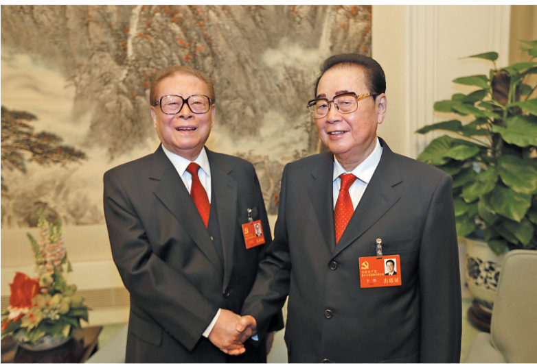
2012年11月8日，在党的十八大开幕前，江泽民同志同李鹏同志在一起。