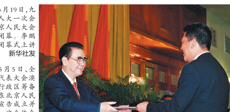
1998年5月5日，全国人民代表大会澳门特别行政区筹备委员会在北京人民大会堂宣告成立并举行第一次全体会议。这是李鹏同志作为筹备委员会主任委员何厚铨颁发任命书。