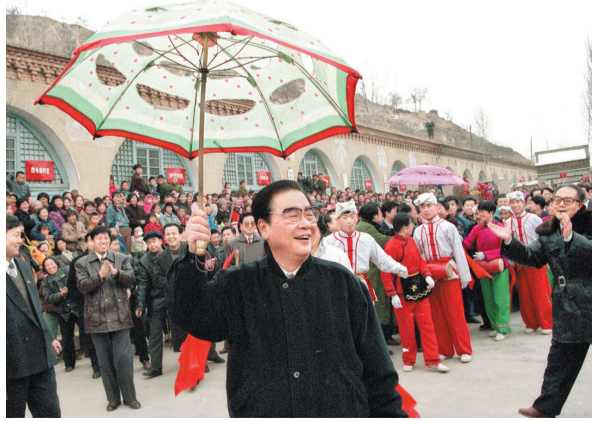
1996年2月19日至20日，李鹏同志回到阔别50年的延安，看望、慰问延安地区的干部群众，和老区人民一起过年。这是大年初一，李鹏同志同枣园村秧歌队一起担起陕北秧歌。

中国共产党的优秀党员，久经考验的忠诚的共产主义战士，杰出的无产阶级革命家、政治家，党和国家的卓越领导人，中国共产党第十二届中央政治局委员、中央书记处书记，第十三届、十四届、十五届中央政治局常委，国务院原总理，第九届全国人民代表大会常务委员会委员李鹏同志，因病医治无效，于2019年7月22日23时11分在北京逝世，享年91岁。