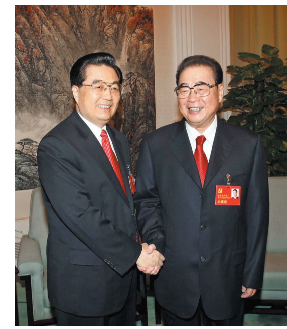
2007年10月21日，在党的十七大闭幕前，胡锦涛同志同李鹏同志在一起。