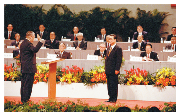
1997年7月1日凌晨，中华人民共和国香港特别行政区成立暨特区政府宣誓就职仪式在香港会议展览中心新翼七楼隆重举行。香港特区首任行政长官董建华宣誓就职，李鹏同志监誓。