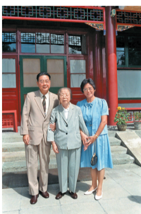
1986年，邓颖超同志和李鹏同志及夫人朱琳在北京南海西花厅合影。