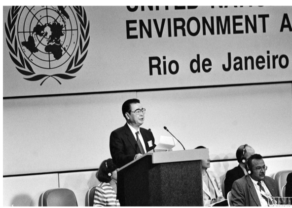
1992年6月12日，李鹏同志在联合国环境与发展大会首脑会议上发言。