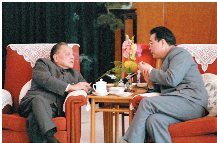
1988年，邓小平同志与李鹏同志在北京人民大会堂福建厅交谈。