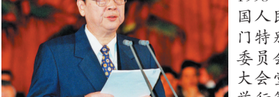
1998年5月5日，全国人民代表大会澳门特别行政区筹备委员会在北京人民大会堂宣告成立并举行第一次全体会议。这是李鹏同志作为筹备委员会主任委员何厚铨颁发任命书。