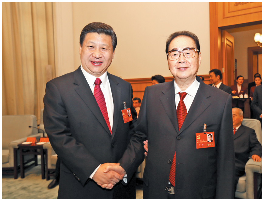
2012年11月14日，在党的十八大闭幕前，习近平同志同李鹏同志在一起。