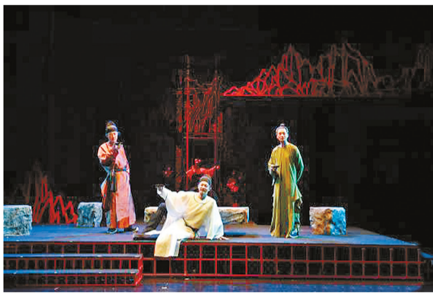
北京人艺话剧《杜甫》剧照。 资料图片