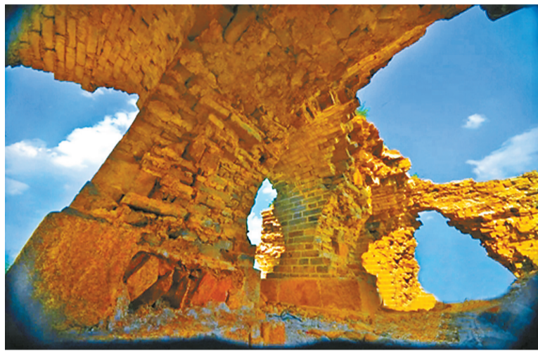
参展作品《北京延庆长城》(2014年)