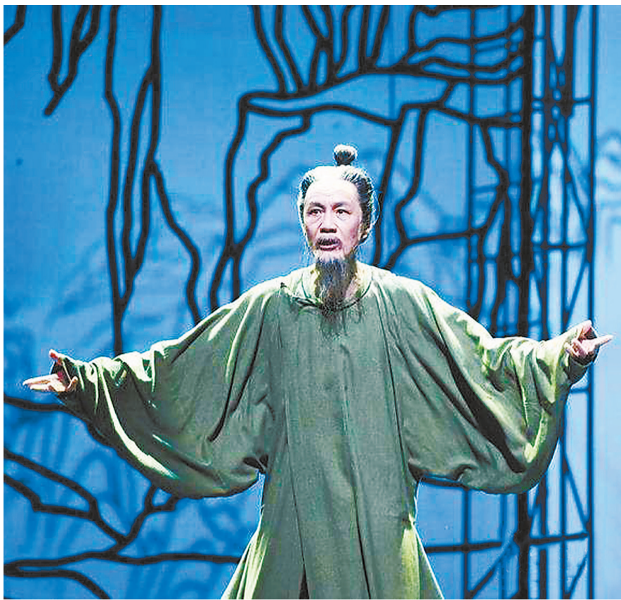
话剧《杜甫》剧照,冯远征在剧中领衔主演诗人杜甫。 资料图片

北京人艺的历史剧向来一戏一格,《杜甫》也不例外。金属质感的舞美创造出刚柔相济的中国传统意境,杜甫与苏涣、李白、高适、严武的一段梦中相会,以及杜甫与夫人杨氏的梦中梦情感归宿,成为剧中一大亮点。