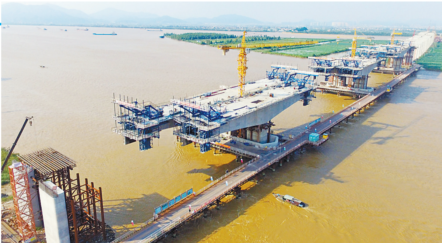
建设中的香海大桥。斗门区将加快形成内联外通、高效衔接的交通网络。