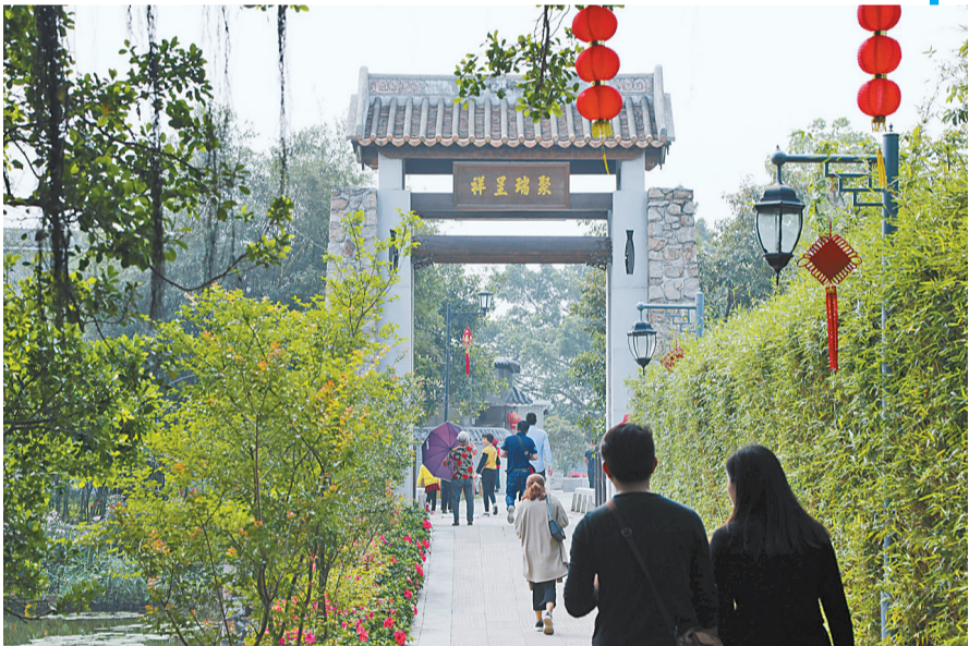
八月的南门村接霞庄引人入胜。

斗门现代产业的承载能力、创新成果的转化能力、优质生活的服务能力、生态文化的供给能力,推动斗门实现更高质量发展,为建设澳珠极点提供重要支撑。