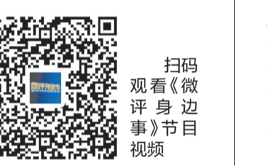
扫码观看《微评身边事》节目视频

共享单车都不应该遭到如此对待。共享单车发展至今,虽然利弊并存,甚至在某些方面的不足已经成为了城市发展的新顽疾。比如在原本就很狭窄的人行道上,横七竖八地摆满了各种颜色的共享单车,影响行人步行;又比如只重投放忽视后续管理,好多不是坐垫损坏就是铃铛不响,车身满是污垢、锈蚀,甚至扫码开锁后根本无法骑行。再有就是车辆的投放不均,有数据显示,香洲区共享单车的存量最高峰值为27万辆,而与此同时,金湾、斗门、高栏,甚至高新区,共享单车的投放却少得可怜。共享单车的种种乱象,并不是仅存在于珠海,目前已经成为了困扰全国诸多城市的普遍难题。为了解决这个难题,各城市奇招频出。在珠海,已经建立起了治理共享单车乱象的防护网,特别是对于运营企业的管理,无论是行政措施,还是立法规范,都已经有了非常明确的限定,但是,对于“人”的管理,似乎还有所欠缺。为什么共享单车的损毁率如此惊人?国内各城市共享单