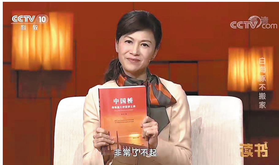
中央电视台科教频道《读书》节目介绍《中国桥》。