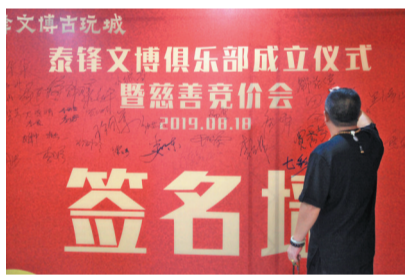
泰锋文博俱乐部成立仪式暨慈善竞价会现场。