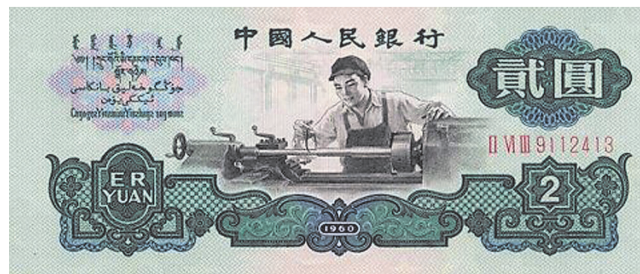
2元面值纸币被钱币圈称为“车工”。

据专家介绍,近年来,随着各种纪念钞、纪念币的密集发行,钱币收藏市场在经历了全民收藏热后,虚火上升已经到了一个极限,开始出现下跌的趋势,一些买家回归理性,将资金撤出。其实,钱币市场的下跌对收藏爱好者来说,冲击是最大的,许多收藏爱好者原本持币观望,希望等其升值到一个新高度再出手,而现在因为买家的减少,不要说钱币升值空间不大,就是想要成交都会变得越来越难,今后或许都将难以成交。专家提醒,收藏钱币与收藏文玩艺术品一样,都需要时间的沉淀。随着钱币收藏队伍的不断壮大,一些停用退出流通领域的钱币和限量发行的纪念币越来越少,受价值规律影响,这些钱币价值将直线上升,并随时间推移,增值潜力越来越大。如果将钱币仅仅视为爱好进行收藏无可厚非,但如果是盲目跟风或想靠偏门致富,那很容易一不小心就被套牢。