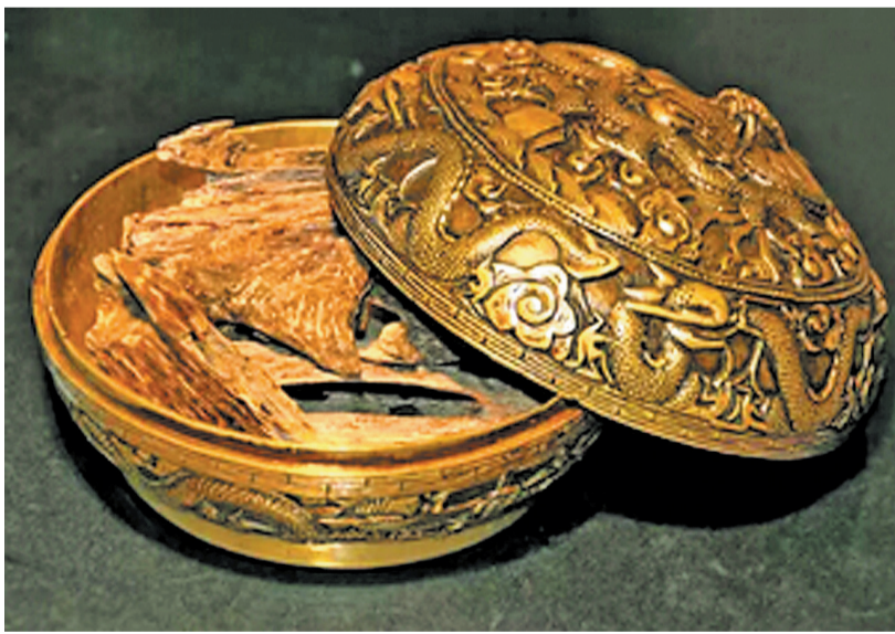
沉香号称“香中钻石”,位列我国四大名香之首。

专家支招,对于喜欢收藏沉香原料的人来说,好的香材具有绝对的竞争力,任何时候香料的的味道都是评判沉香优劣的首要因素,因此收藏者要学会“闻香”识好木。一款沉香或许油脂含量一般,但若其味道极佳,则会大