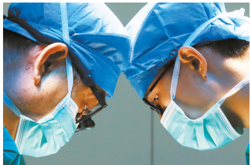
手术中全神贯注的医生。