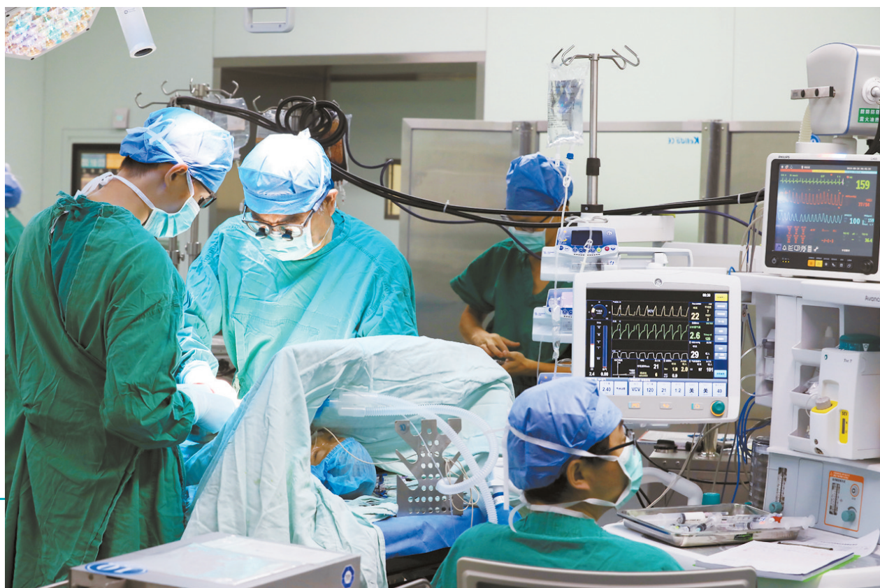
全体医护人员通力合作,手术顺利进行中。