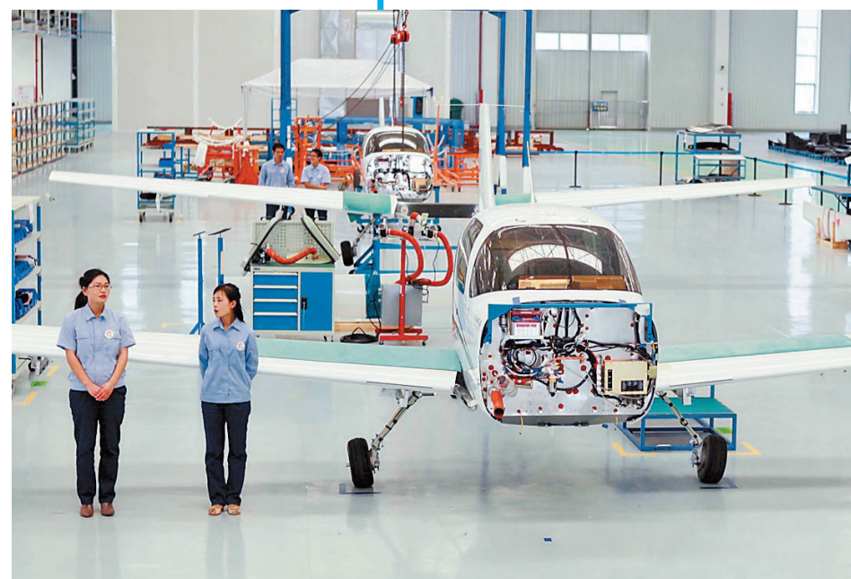
航空工业通飞生产基地。

金湾区要担当好历史使命,关键在加强党的领导和党的建设。金湾区委四届九次全会指出,此次省委巡视指出了许多长期困扰金湾区且自身又难以解决的深层次问题,全区各级党组织和广大党员干部要把抓好巡视反馈意见的整改落实作为一项重要政治任务。金湾区接下来将全面落实中央和省、市委“不忘初心、牢记使命”主题教育部署,结合持续推动“思想大解放、作风大转变、效率大提升”,营造干事创业的良好氛围,以巡视整改的实际成效凝聚起推动金湾经济社会发展的强大动力。