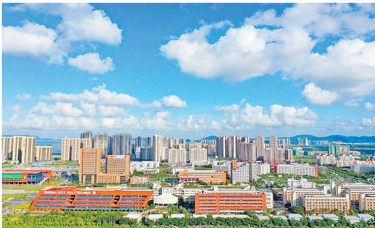
金湾航空新城一栋栋高楼拔地而起,城市新中心即视感扑面而来。

浪花拍岸,梦想激荡。如今,站在珠海大桥上向西远眺,金湾航空新城一栋栋高楼拔地而起,城市新中心即视感扑面而来。