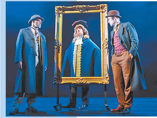
话剧《福尔摩斯谜案:巴斯克维尔的猎犬》剧照。

古堡中诡异的哭泣声,传说魔犬的巨型爪印,接二连三的惊奇命案在巴斯克维尔庄园里频频出现……9月4日-9日,伦敦西区话剧《福尔摩斯谜案:巴斯克维尔的猎犬》在中国国家大剧院上演。