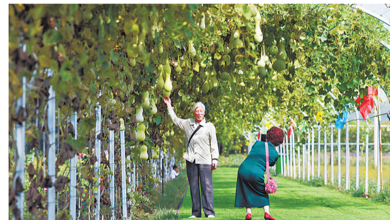
9月15日,游客在呼延村的花海景区内拍照。 时下,山西省太原市尖草坪区呼延村的呼延鼎盛花海景区内,各类花卉竞相盛开,吸引了众多游客前来参观。

近年来,呼延村积极发展花卉产业,逐步打造集花卉观光、休闲娱乐、户外拓展等多功能于一体的乡村旅游景区,帮助村民在家门口增收。