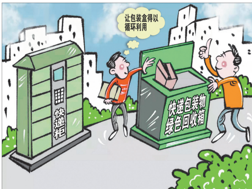
循环利用 新华社发 商海春 作

近日,在浙江省桐庐县举办的第三届中国(杭州)国际快递业大会上,国家邮政局局长马军胜表示,2019年中国的快递业务量将突破600亿件,增量领跑全球。