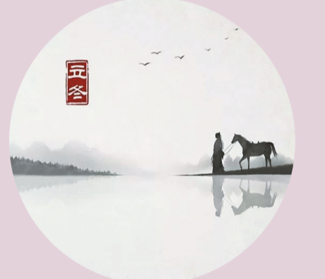
小林漫画作品。均系资料图片