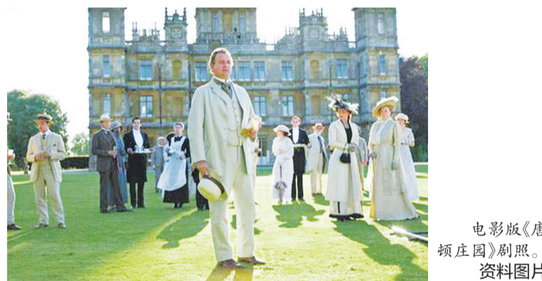
电影版《唐顿庄园》剧照。

作为英国热门电视剧《唐顿庄园》拍摄地,汉普郡海克利尔城堡在全球知名民宿短租平台爱彼迎网站上招募两名房客,请他们在城堡内度过“穿越”一晚。