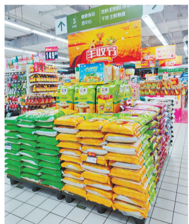
丰收体验区增加了特色农产品。

5月,华润万家广东公司在贵州毕节建立了6个消费扶贫性质的农超对接基地,在深圳、广州、珠海等600多家门店设立毕节农产品销售专区,以产销对接等方式,助力贵州毕节农产品“出山”。为给顾客带来优质的果品,助力宁夏“富硒”产业发展,华润万家同样以基地直采的模式,采购素有“石头缝里长出的