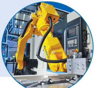
格力G-FMS柔性制造系统。