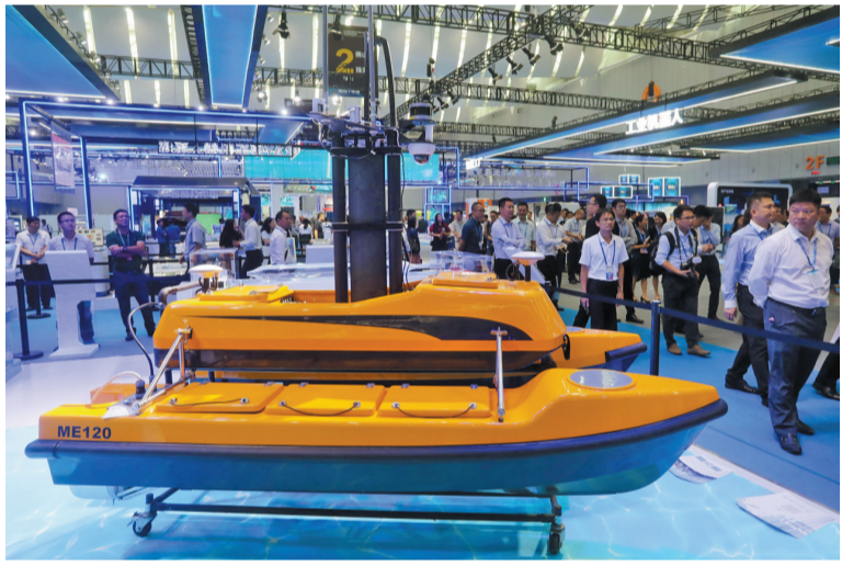
云洲智能科技无人船。

“智能制造”方面,以ABB和格力智能装备为龙头,云洲智能、运泰利自动化、广浩捷等一大批本地培育的智能制造企业茁壮成长,初步形成机器人本体制造、核心零部件生产、系统集成、自动化解决方案的产业链条。格力智能装备已成功实现三大核心部件(减速机、控制器和电机)的自主研发;ABB工业机器人应用公共技术服务平台为华南地区企业升级提供合作、开发、培训等服务。