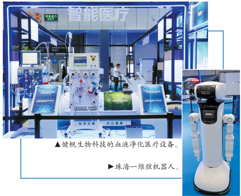
▲健帆生物科技的血液净化医疗设备。

本届“珠洽会”上,珠海签约项目共39个,总投资额达到220.16亿元,其中超10亿元项目7个。