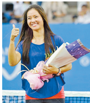
李娜:来“武网”,不后悔!

不久前,退役五年的李娜正式加入国际网球名人堂,成为中国乃至亚洲第一位获此殊荣的选手。作