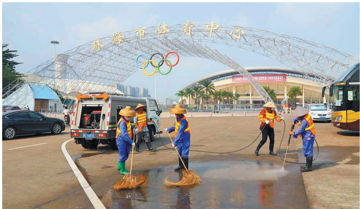
近期,我市持续开展“市容环境大扫除,干干净净迎国庆”活动,以更加干净、整洁、有序的面貌迎接新中国成立70周年。据城市管理局

入夜,野狸岛公园霓虹闪烁,灯光景色蔚为壮观。据公园管理人员介绍,野狸岛公园北面广场、南面广场共布置了长约2400米彩灯带,增加了50组射灯、两组流星雨灯,勾勒出如幻如梦灯光夜景,美不胜收。