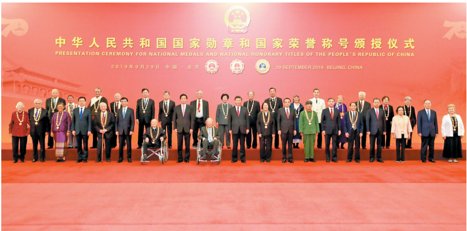
9月29日,中共中央总书记、国家主席、中央军委主席习近平向国家勋章和国家荣誉称号获得者颁授勋章奖章并发表重要讲话。