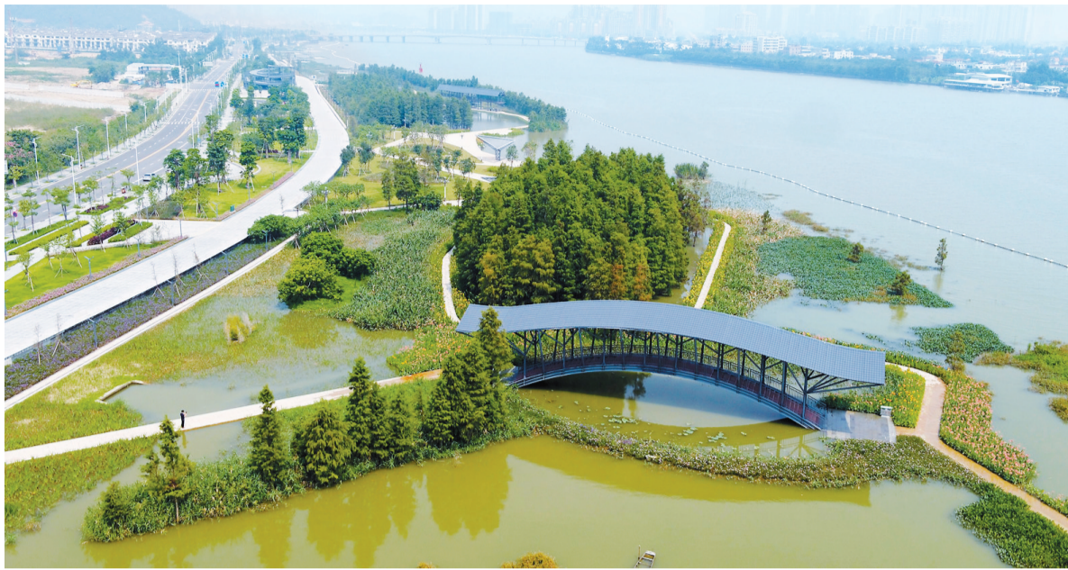
黄杨河湿地公园全景俯瞰图。

据了解,黄杨河湿地公园是斗门区的重点生态建设项目,面积约40万平方米,主要建筑有滨水观景台、藕丝亭、观河廊架、招潮台、观