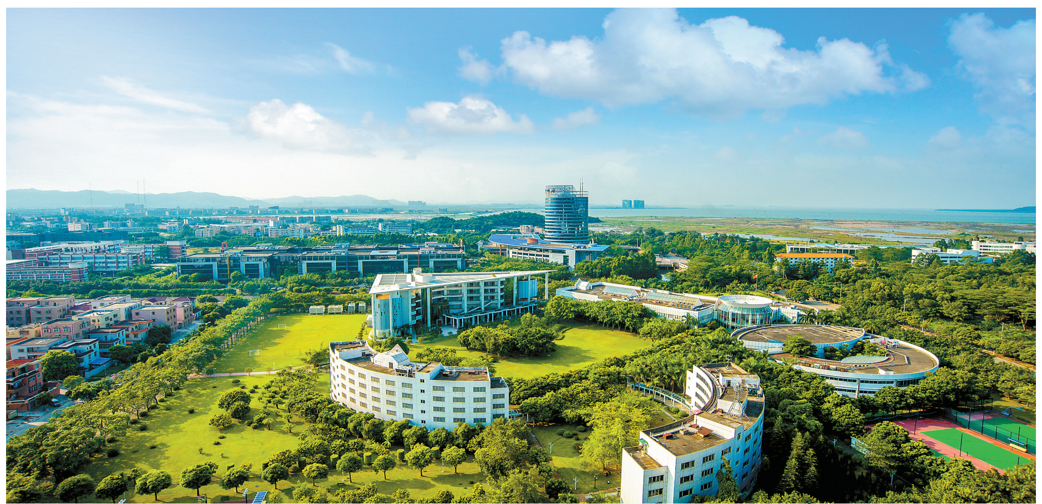
高新区深入实施创新驱动发展战略,大力发展民生事业,着力打造宜居宜业宜游优质生活圈。

2018年10月23日,举世瞩目的世纪工程港珠澳大桥正式开通;2019年2月,《粤港澳大湾区发展规划纲要》正式发布。在双重利好加持下,珠海迎来了前所未有的历史发展机遇,粤港澳大湾区建设就此迈进快车道,珠海高新区也按下了加入大湾区建设的“快进”键。