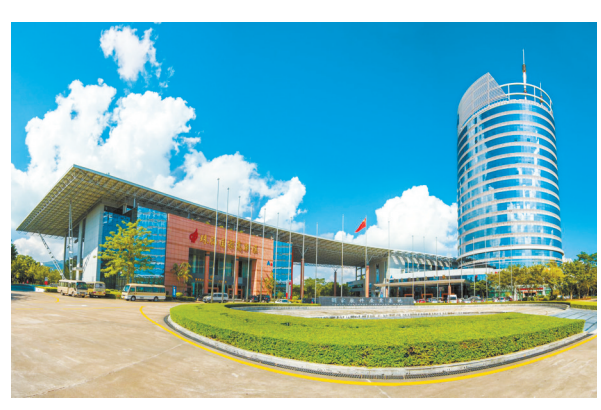
不断优化创新创业环境。

六是优化创新创业环境。推进省双博基地建设,新设港澳人才创业孵化梦工场专区,不断完善科技金融服务体系,股权投资平台完成区内项目投资4.19亿元;“成长之翼”助贷平台新增授信72笔,新增授信额度5.22亿元;信用评估平台新增注册企业35家、评估企业60家;融资对接平台组织“双自联动”银企对接会、上市挂牌培训会等多种形式的活动共15期。“菁牛汇”创业大赛已进入复赛阶段,将从502个项目中遴选48个项目进入决赛。