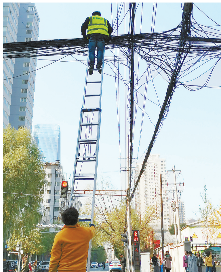
11月2日,在兰州市城关区农村巷,施工人员对架空线缆进行清除的登记确认。

甘肃省兰州市为解决城区各类架空线缆乱搭乱设、随意布置的空中“蜘蛛网”问题,美化城市环