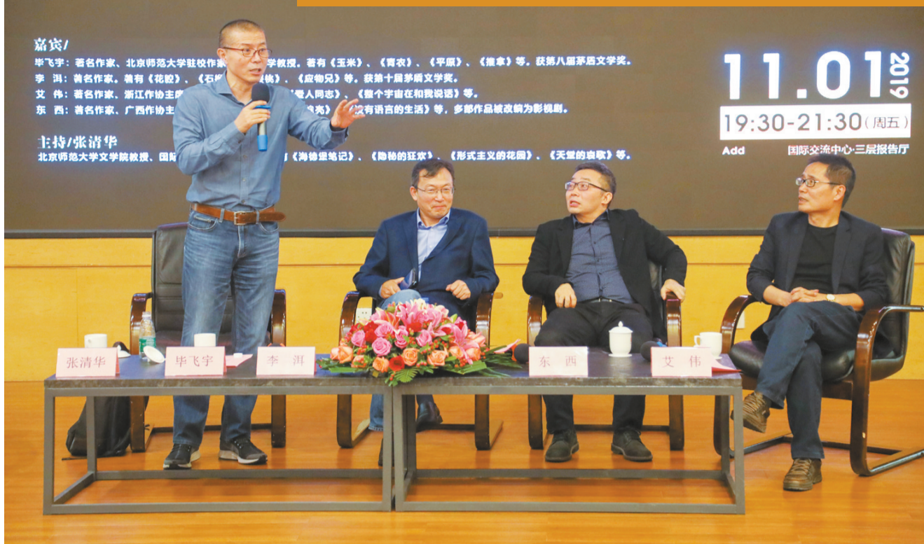
新生代作家四人谈活动现场。(从左至右毕飞宇、李洱、东西、艾伟)

1日晚,“三十年·四重奏——新生代作家四人谈”活动在北京师范大学珠海园区国际交流中心举行,活动由北京师范大学国际写作中心主办。