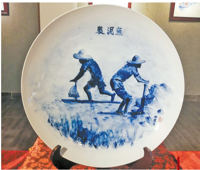
斗门区非遗瓷艺展现场。

斗门区有非遗项目29个,其中国家级2个,省级6个,市级19个。本次瓷艺展上,观众既能观赏到各种造型精美的瓷器,又能近距离体验非遗项目的文化精髓。