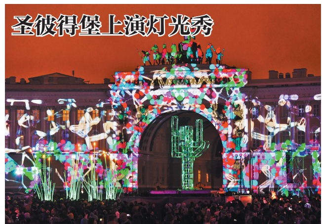
11月3日,俄罗斯圣彼得堡市中心的冬宫广场举行“奇妙光影”灯光秀文化节。

据市委老干部局的相关负责人介绍,珠海是本次联展的最后一站,珠海站的展期为4日至15日。本次联展共展出作品247幅,其中书画作品157幅、摄影作品90幅。这些作品主题鲜明、形式多样、内容广泛、品味高雅,从不同角度弘扬中华民族优秀传统文化,充分表达了“胸中有大义、心里有人民、肩头有责任、笔下有乾坤”的爱国情怀。