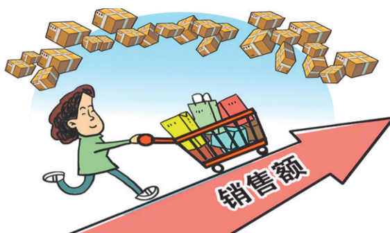
数字之变: 销售额从0.5亿元猛增至2018年的2135亿元