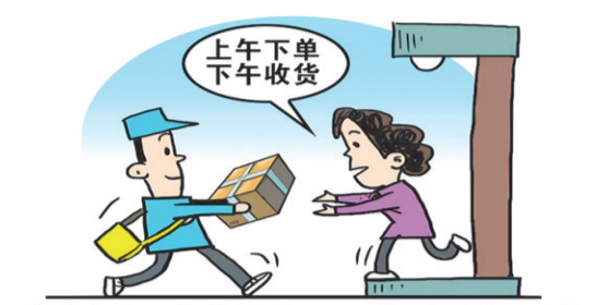
效率之变: 快递从“下周见”到“今日达”

在网上搜寻、关注、购买各个领域最新潮流商品。尤其是一些创意产品,让互联网具备了“启发消费”的新功能。