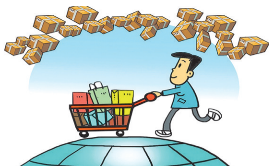
市场之变: 从“买全国”到“买全球”