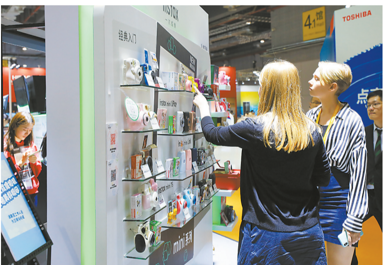
11月10日,参观者在第二届进博会日本富士展台前驻足观看。在上海国家会展中心举行的第二届中国国际进口博览会10日闭幕。

此外,上海在主要口岸开设了进博会服务专窗和专用通道共计125个,全天候服务进博会人员及展品进出,通关效率较首届提高62.5%,最快展品通关只需15秒。