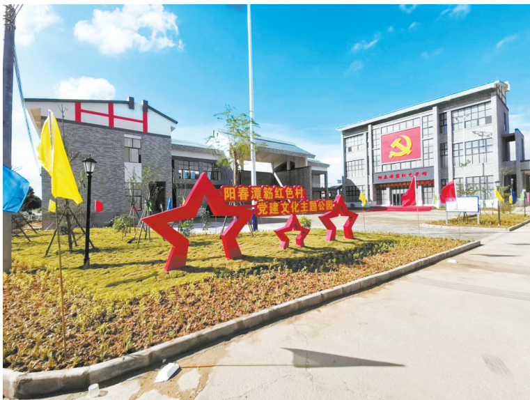
珠海帮扶阳江市阳春潭桥村建设的红色展馆。

金秋十月,稻黄果熟。果园里硕果累累,火龙果、百香果挂满枝头。果农正热火朝天采摘果实。有机蔬菜基地繁忙一片。菜农们根据电商平台的订单,采摘最新鲜的蔬菜。池塘中,鱼虾跳跃,鸡鸭成群结伴戏水悠游。