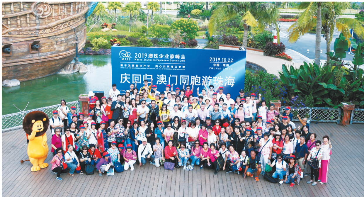
“庆回归 澳门同胞游珠海”主题踩线活动出发仪式在横琴举行。