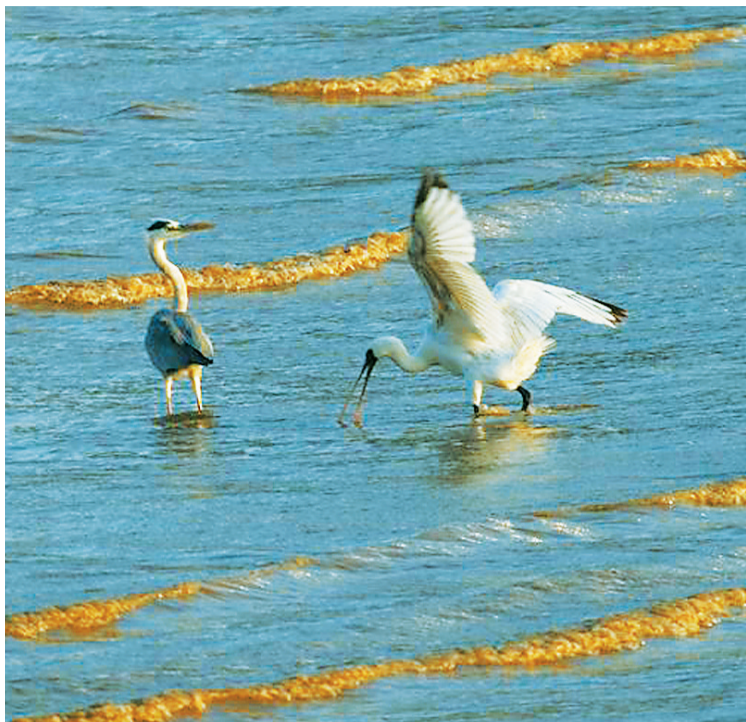
11月12日,黑脸琵鹭和苍鹭在拱北口岸附近水域活动。

从改造前杂乱的芭蕉林到如今完善的生态片区,芒洲湿地公园不仅引回了濒危物种黑脸琵鹭,也保有丰富的野生动植物资源。在红树林湿地系统已记录的生物就有157种,包括红树林植物16种、鱼类81种、鸟类60种。