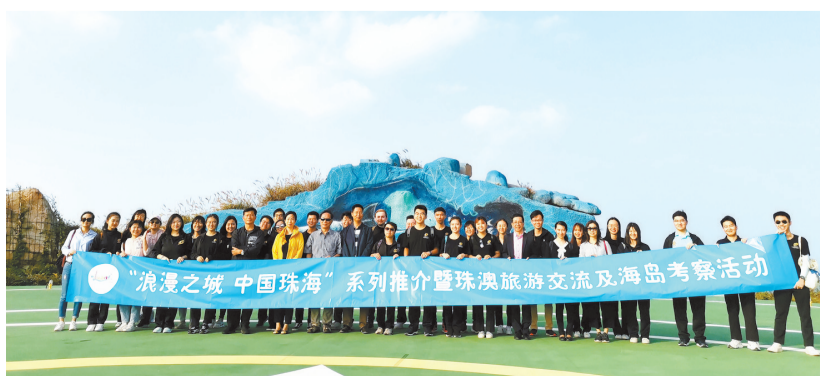
澳门旅游学院师生到我市东澳岛参加推介交流及考察活动。

的旅游教育培训品牌,致力提升旅游从业人员素质,推动国际旅游人才交流互动,促进粤港澳大湾区旅游产业发展。11月9日,“浪漫之城 中国珠海”旅游推介及海岛旅游考察活动举行,澳门旅游学院受邀师生、旅游业界代表近百人参加。这是该中心成立以来开展的第一次活动。