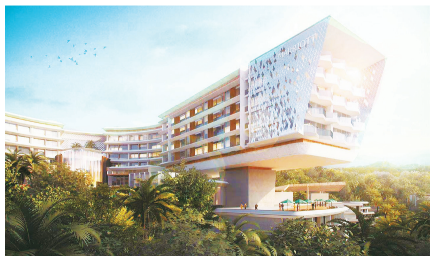
万豪酒店的悬挑钻石套房:将流线形态与自然风光无缝融合。

与其他传统五星级酒店千篇一律的外观相比,万豪度假酒店设计在造型上尤为惊艳。据介绍,酒店总建筑面积约35000平方米,设计方面,极具地域标识性、唯美意境的