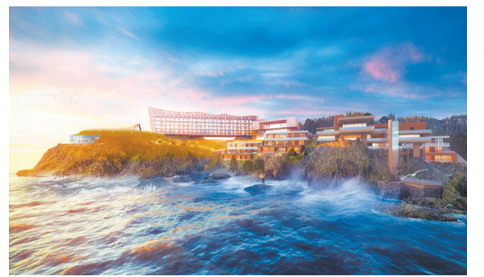
阿丽拉东澳岛·珠海酒店。