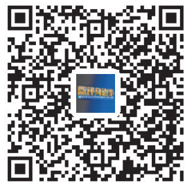
扫码观看《微评身边事》节目视频