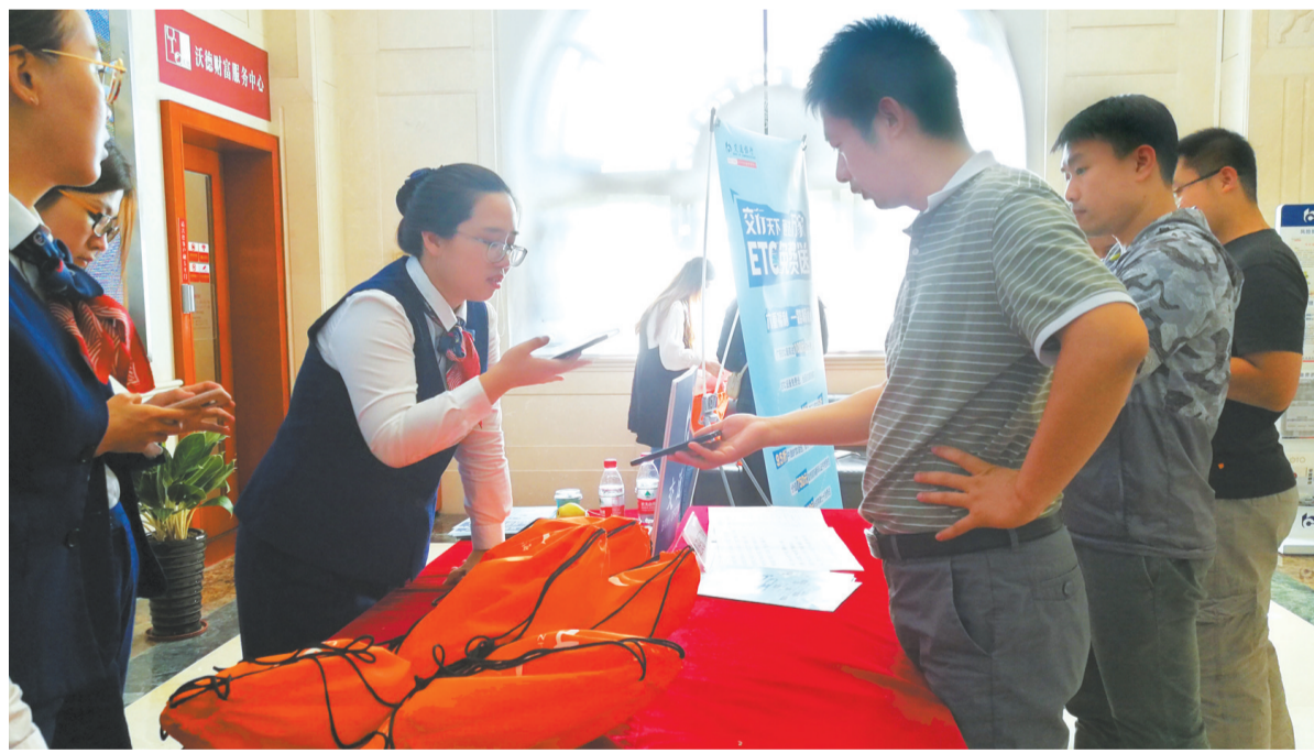
徒步活动参与者领取物资包。

华发股份“最美海岸·珠澳同行”——2019珠海30公里徒步活动明天启幕。昨天,徒步活动参与者前往指定地点领取物资包,为接下来的徒步做准备。物资包领取时间