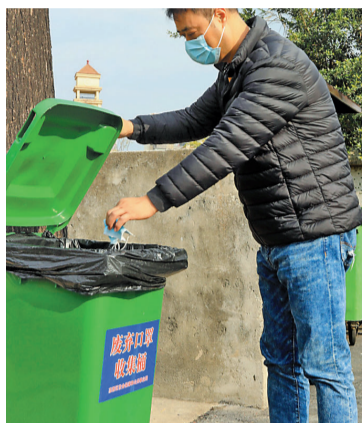
高新区东岸社区设置了废弃口罩收集桶。