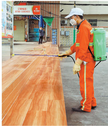
高新区东岸社区环卫工人正在进行消毒消杀。

面加强公厕、广场、公园、垃圾、中转站等场所的消毒工作,并确保垃圾日产日清,切实降低传染病通过环境传播的风险。截至1月27日下午,金湾区已在各小区、公共区域设置“废弃口罩垃圾收集点”130处,方便群众投放废弃口罩。