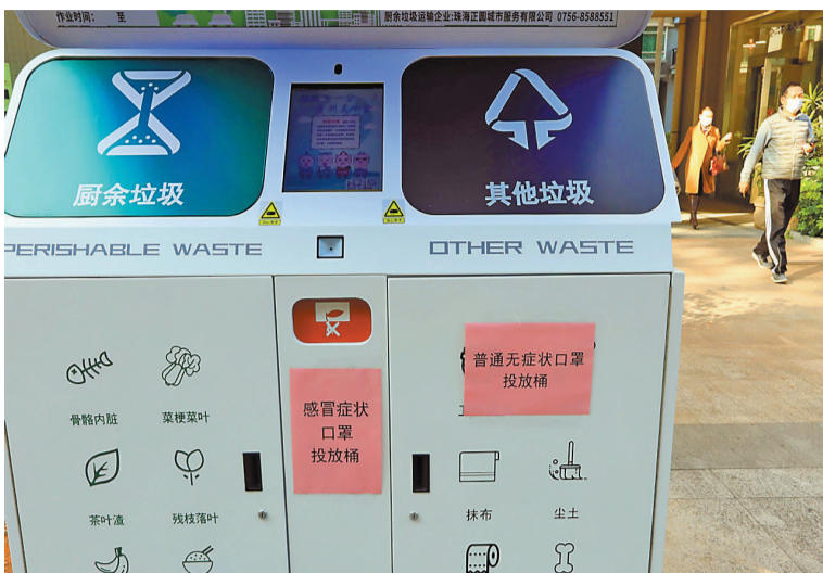
小区(三好名苑)内“智能环保屋”张贴出废弃口罩投放指引。