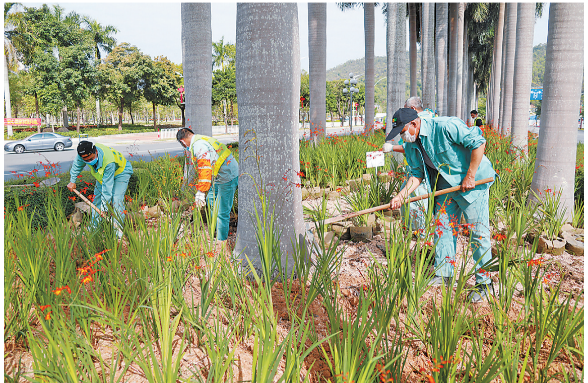
2月22日,园林绿化工人正在一块绿地上施工。

本报讯 记者马涛报道:一手抓疫情防控,一手抓复工复产。记者23日从城市管理综合执法局获悉,连日来,该局积极把握春季有利时机开展园林绿化管理,全市园林绿化复工复产工作正有序开展。不过,为避免人员聚集,目前,全市公园仍实行闭园管理。 2月22日,在梅华城市花园旁,两名园林绿化工人正在一块绿地上施工。据了解,在梅华城市花园绿地作业的是珠海市香洲正方控股有限公司的园林绿化工人。该公司绿化管养复工复产方面,目前除滞留重点疫情地区人员未返回复工外,其他人员已返回岗位,日常绿化管养工作已基本恢复正常作业。 香洲正方绿化管养复工复产是全市园林绿化复工复产有序开展的一个缩影。记者随后从城市管理综合执法局获悉,疫情发生以来,我市园林绿化管理部门积极贯彻落实上级部门关于疫情防控各项措施,确保疫