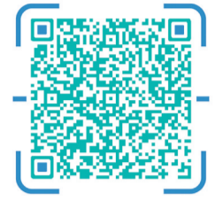
扫描二维码,了解观海融媒APP相关推文