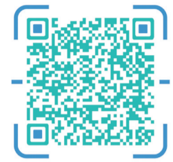
扫描二维码,观看珠海特区报微信公众号相关视频