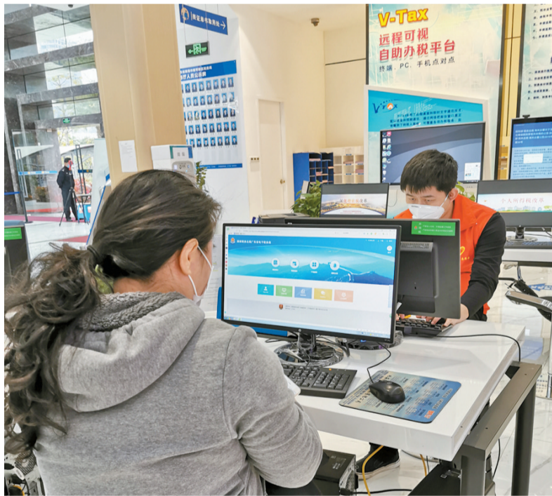
横琴新区税务部门辅导企业通过V-Tax平台快速办理业务。

V-Tax平台经过3年多的成功运行,实现了从创新、成熟到示范的蜕变。据统计,V-Tax平台近一年来累计受理涉税业务超过25000宗,其中港澳跨境涉税业务超过四